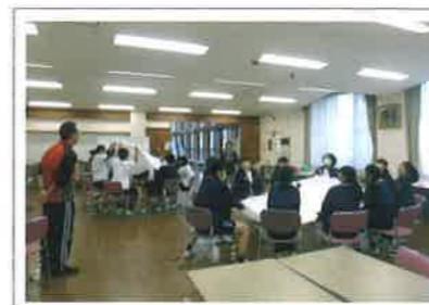
レクリエーション実習