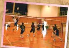
女子バレーボール

ハ尾高校では、毎年インターハイに出場しているボート部や地元の伝統芸能であるおわらを各地で披露する郷土芸能部をはじめ、様々な部が盛んに活動しています。みなさんもハ尾高校でともに活動しませんか。