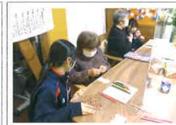
高齢者デイサービス