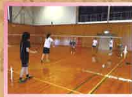
女子バドミントン部