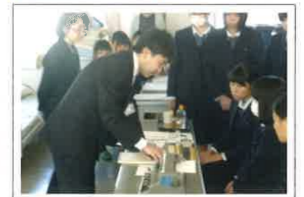
特別支援教育に関わる講座