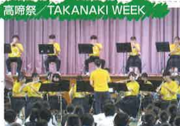
高啼祭 / TAKANAKI WEEK