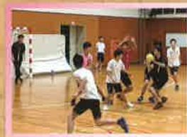
男子ハンドボール部