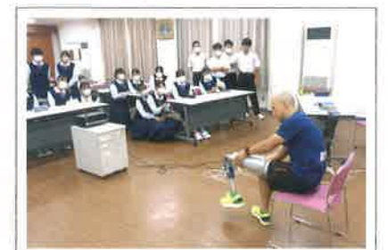
福祉講座(ギソクの図書館)