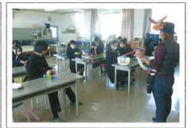
バルーンアート講習会