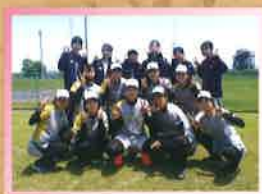
女子ソフトボール部