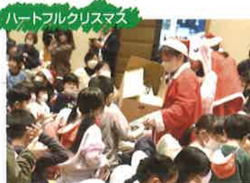
ハートフルクリスマス