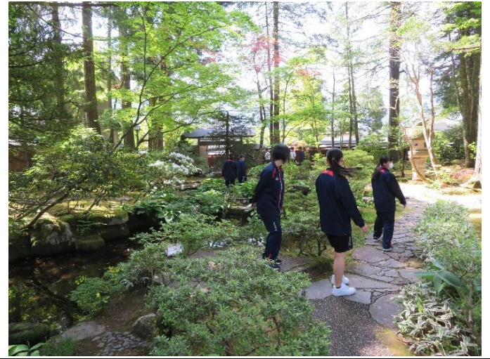
宿坊「教算坊」の庭園