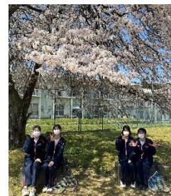
テニスコートの桜の下で↑