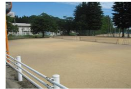
(パインパーク・本校テニスコート) 恵まれた練習環境