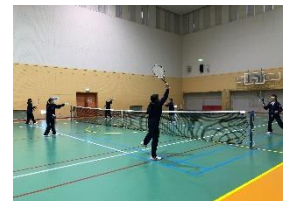
八尾アリーナでの練習の様子↑