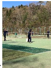
西山テニスコートにて→