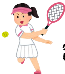
八尾アリーナでの練習の様子 ↑