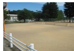
(パインパーク・本校テニスコート)