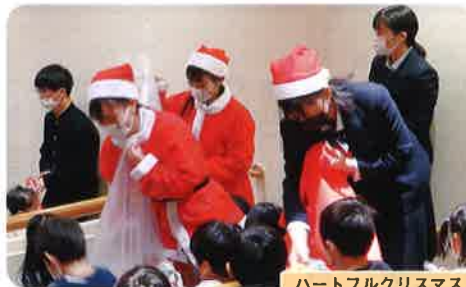
ハートフルクリスマス

誰もが分け隔てなく、安心して、個性を発揮し、ともに暮らしていくことのできる社会。その社会の実現に向けて、相手に寄り添う福祉マインドを持ち、広い視野で活動する実践力を持った人材、将来、 地域や社会に貢献できる人材の育成 を目指しています。