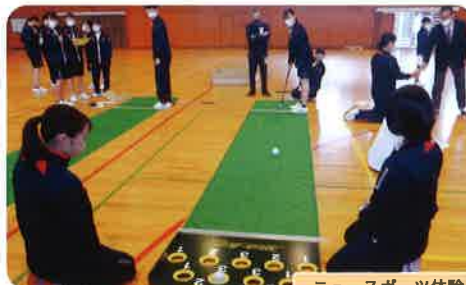
ニュースポーツ体験