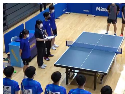
富山インターハイ 審判