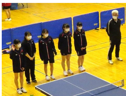
県総体 女子学校対抗